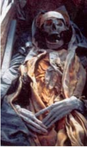
La supposta Vittoria così come è apparsa all'atto della prima ricognizione