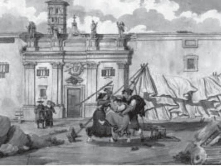
Roma - San Silvestro in Capite, Rione III, Colonna, Piazza di San Silvestro (acquerello di Achille Pinelli)

Infatti a S. Silvestro aveva ricevuto nel 1536 la visita di Carlo V. Inoltre, in quel sereno autunno del 1538, ogni domenica, nell'oratorio di S. Silvestro al Quirinale - dove abitualmente si portava per ascoltare la Messa - era stata l'indiscussa moderatrice delle conversazioni cui partecipavano pochi ed eletti amici. Fra questi c'era il grande Michelangelo, a lei accomunato da «un'inclinazione a ideali e principi», a torto ritenuti dal Papini «di sapore quasi protestantico» 21 . Invece, già discepolo spirituale del Savonarola e anticuriale, auspicava a sua volta una riforma morale nella Chiesa, ma non contro la Chiesa, ideale che era alla base di quella «stabile amicizia e legata in cristiano nodo sicurissima affezione» per quella donna ideale, che fu da taluni biografi chiamata senz'altro «amore». Inoltre, se appariva amante della solitudine, era senza dubbio per scelta etica e per indipendenza dalle lusinghe e dai ricatti di ogni genere 22 .