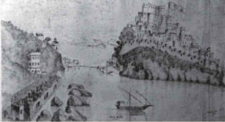
Mario Mazzella - Il Castello e la Torre detta di Michelangelo (Disegno a penna da un affresco di Ignoto del XVI secolo)