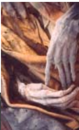
Particolari delle mani