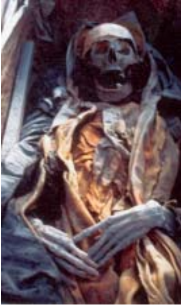
La supposta Vittoria così come è apparsa all'atto della prima ricognizione