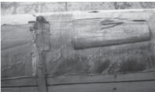
Due immagini dell'arca coperta di velluto color cremisi