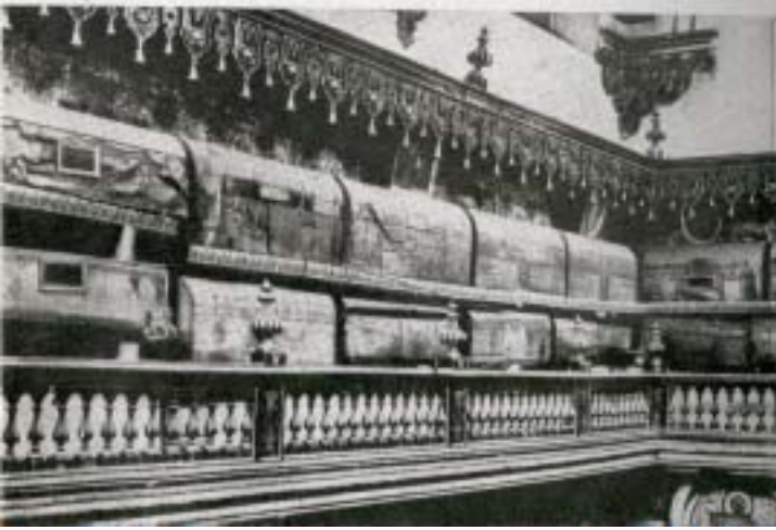
I «tanti» in S. Domenico Maggiore

all'esplicito ordine impartito al riguardo proprio da papa Pio V 11 . Tenuto conto poi dell'accanimento con cui era stata condotta dal Sant'Ufficio l'indagine sul conto della Colonna, non ci sembra neppure il caso di supporre - come ritiene l'Amante 12 - trattandosi della zia di Marcantonio, tanto benemerito per la vittoria di Lepanto, eccezioni di sorta. Queste ci furono senz'altro, ma altrove: basti pensare a S. Domenico Maggiore in Napoli, dove tuttavia è probabile che i vari trasferimenti dei «tanti» in sacrestia, tra cui quello di Ferrante d'Avalos, siano avvenuti proprio a seguito del decreto di papa Pio V ed in ogni caso con notevole ritardo. Ciò era tanto più grave, in quanto quest'ultimo era un Papa domenicano! Probabilmente, per non dar l'impressione di contravvenire all'ordine del Papa, ad avviso del quale si sarebbero dovute togliere le arche di legno dalle Chiese e sep-