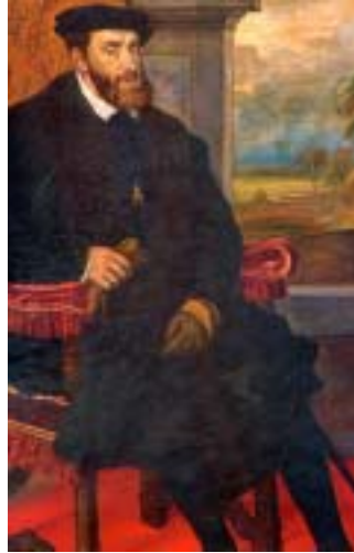
Tiziano - Carlo V (Monaco, Alte Pinakothek)

di Napoli, tenne un comportamento così ambiguo, da suscitare le più vive preoccupazioni in Vittoria, la quale, intervenendo efficacemente, riuscì a distogliere il marito dal tradimento. Infine, agonizzante non senza sospetto di veleno ad appena 36 anni, solo allora si ricordò di Vittoria: la volle accanto a sé, ma quest'ultima non giunse in tempo. A Viterbo, informata della morte del marito, rimase a lungo priva di sensi e, quando si riebbe, secondo la testimonianza degli amici più cari, accarezzò persino il proposito del suicidio. È facile perciò comprendere i motivi di quel suo distacco dal mondo, che ai più sembrò quasi una rinuncia alla vita. Ottenne infatti agevolmente da papa Clemente VII il consenso a rifugiarsi nel convento di S. Silvestro in Capite, ma non a prendere il velo come avrebbe desiderato, sotto pena di scomunica per le monache 18 , qualora glielo avessero permes-