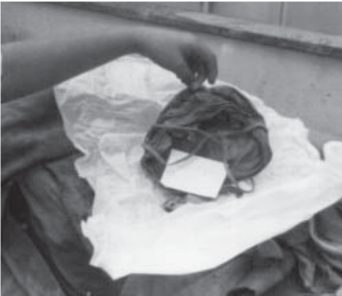
Cuffia di lino trovata nell'arca n. 28

nell'arca n. 28 forse - giudichino i lettori se gli indizi raccolti sono probanti - Vittoria Colonna. A prescindere dalle difficoltà insorte nella determinazione del sesso, numerosi elementi conforterebbero tale opinione. Ci riferiamo in primo luogo agli indumenti chiaramente femminili, con particolare riguardo alla cuffia di lino, a quel velo che scende ai due lati del volto, alla camicia di lana e, poiché sono bianchi al pari della zimarra, non possiamo non ricordare che il bianco nel secolo XVI indicava