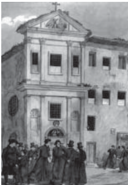
Chiesa e Convento di S. Anna de' Funari (anche Sant'Anna dei Falegnami) al Rione VIII, Sant'Eustacio. Demolita. (acquerello di Achille Pinelli)