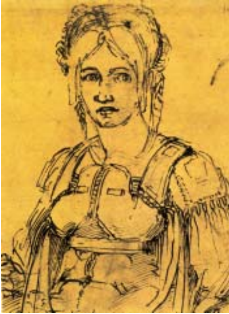
Vittoria Colonna: suo presunto ritratto disegnato da Michelangelo (British Museum, Londra)

alle qualità sue esaltate dal biografo contemporaneo Filonico Alicarnasseo, che erano, sì, «qualità bellissime, ma... non proprio quelle che più spesso si ritrovano nelle donne tutte donne» 14 . Forse Vittoria doveva proprio all'altezza del suo carattere, alla sua virtù, per cui veniva chiamata «Chietina» dall'Aretino, al suo ingegno superiore, a quella bellezza spirituale esaltata dal Giovio, all'energia con cui seguiva gli interessi del marito, qualità espresse in modo significativo da quella formula «mulierum superegressa sexum» (oltrepassando il sesso femminile), usata da Clemente VII e ripetuta non a caso da Paolo III, se riusciva a superare la lontananza e, aggiungeremmo, l'indifferenza del Marchese. Non va dimenticato al riguardo che «il