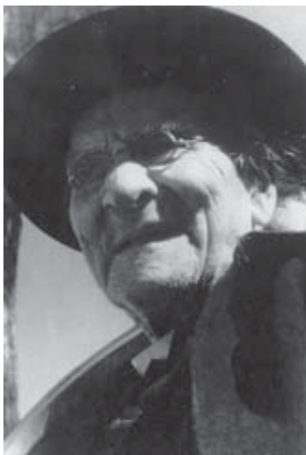
Mons. Onofrio Buonocore, cantore della poetessa Vittoria Colonna