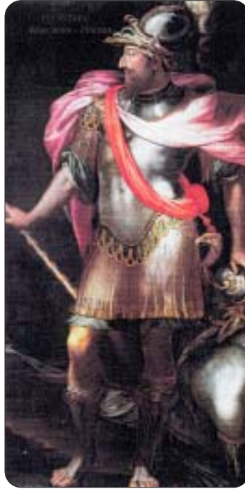
Francesco Ferrante d'Avalos Marchese di Pescara (di Anonimo)

do ella viveva ad Ischia alternando i suoi soggiorni tra la villa Pietralba, alle falde di S. Elmo, e il bel palazzo di via Tribunali in Napoli, il matrimonio non le riservasse molte gioie, essendo ben presto offuscato da incrinature e soprattutto dall'angoscia di lunghe separazioni. Infatti il Marchese di Pescara, giovane, avvenente - al punto che Isabella, duchessa di Milano, confessò che avrebbe desiderato a sua volta una ferita in viso, per vedere se le avrebbe conferito la stessa sua fiera grazia -, ardimentoso e geniale condottiero al servizio del suo re, ben presto cominciò a tradirla a destra e a manca senza nemmeno darsi pena di nasconderglielo.