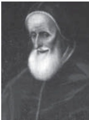
Il papa Pio V

senz'altro che lo stesso sia stato deposto «in basso» cioè nel sepolcreto comune delle monache, del che è convinto lo stesso Don Fabrizio.