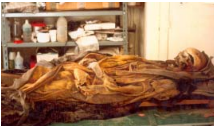
La salma n. 28 nel piccolo laboratorio organizzato a S. Domenico

Ricognizione dell'équipe diretta dalla dott.ssa Portoghesi