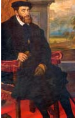
Tiziano - Carlo V (Monaco, Alte Pinakothek)