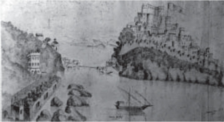
Mario Mazzella - Il Castello e la Torre detta di Michelangelo (Disegno a penna da un affresco di Ignoto del XVI secolo)