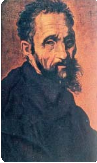
Michelangelo - Autoritratto

golare benevolenza, il successore Paolo III, sinceramente preoccupato per il futuro della Chiesa, raccomandava addirittura a lei nel 1546, nonostante i gravi affronti subiti ad opera di Ascanio nel corso della tragica guerra del sale, di caldeggiare un'eventuale successione del card. Sfondrato 27 . In ogni caso c'è chi sostiene che Vittoria «compì quasi un ufficio di maternità in bene della Chiesa» e che «ebbe qualcosa dello spirito e dell'azione di Santa Caterina da Siena» 28 . Il Fontana poi, riepilogando la sua dissertazione a difesa dell'ortodossia di Vittoria, conclude espressamente: «Coloro che segnarono Vittoria fra gli eretici, come sospetta di eresia, fecero opera nefanda» 29 .