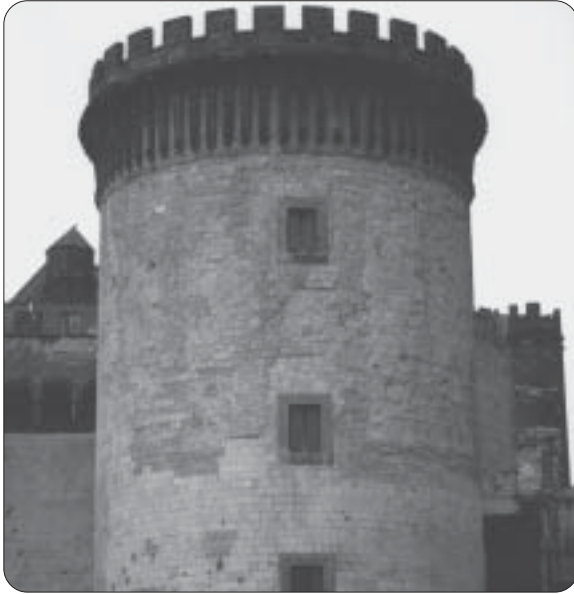
Napoli: Castelnuovo - La Torre de oro, in cui tenuto prigioniero Ascanio

santa divulgarono non poche leggende su quella santità; altre invece, che la ritenevano eretica, testimoniarono addirittura contro di lei dinanzi al Santo Ufficio» 4 .