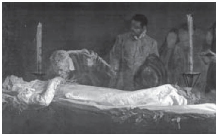
Michelangelo visita la salma di Vittoria Colonna, cui bacia la mano