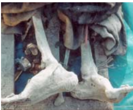
Particolare della barella e dei piedi