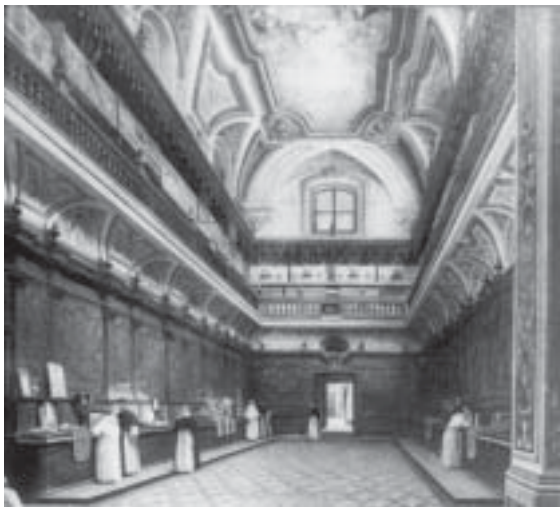
Sagrestia della Chiesa di S. Domenico Maggiore

Napoli delle spoglie della sorella, non solo perché qui aveva ancora molti interessi, ma anche perché sapeva che in tal modo avrebbe aderito al più vivo desiderio di lei, che aveva appunto scritto: