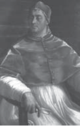
Il papa Clemente VII di Sebastiano del Piombo (Galleria di Capodimonte, Napoli)