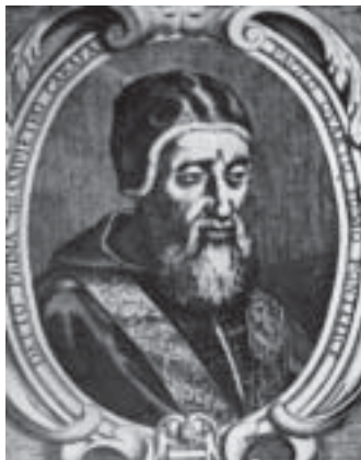
Papa Paolo IV

per venerabilem abbatissam iuxta stilum et consuetudinem ipsius monasterij». Questa infatti non autorizza a ritenere che Vittoria «nel comune sepolcro delle monache di S. Anna venne deposta» 13 , ma solo che desiderava essere sepolta in una tomba «speciale» da scegliersi ad opera della Badessa o, a nostro avviso, solo in una tomba da designarsi nella Chiesa annessa al Monastero.