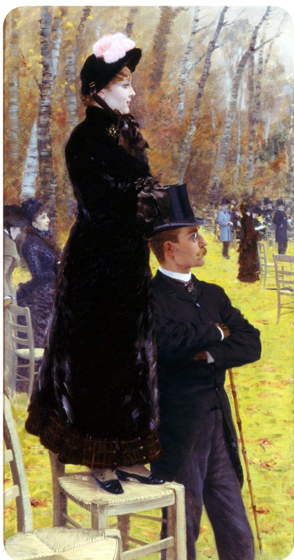
Giuseppe De Nittis Alle corse di Auteil

umidi e brillanti di luce infantile... la pittura è sporca, ma il tono è giusto... e... dipinti con una semplicità antica 7 . “Con i soggetti dell’infanzia povera egli mette in primo piano un’umanità diseredata, di toccante valore intimistico, con raffigurazioni che impressionano e mettono a