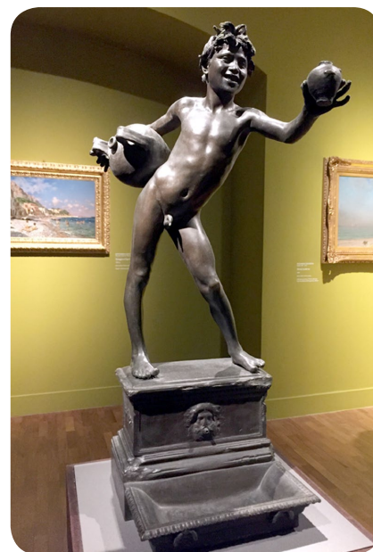
Vincenzo Gemito Acquaiolo, 1881