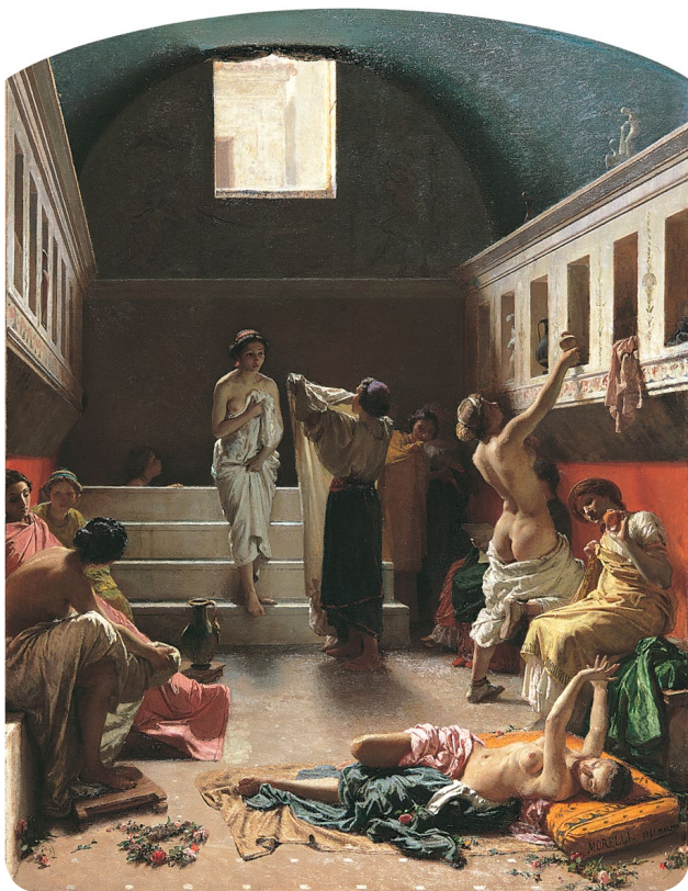
Domenico Morelli - Bagno pompeiano